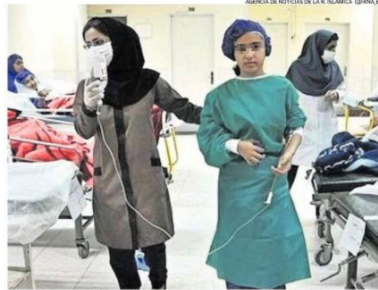
LOS DETENIDOS TENÍAN MOTIVOS HOSTILES PARA CREAR MIEDO EN LA POBLACIÓN Y ESTUDIANTES.

Hasta ahora, han resultado envenenadas alrededor de 5.000 alumnas de 230 centros educativos en 25 de las provincias iraníes, según los datos proporcionados por el parlamentario Mohammad-Hassan Asadlari, miembro de una comisión que investiga las intoxicaciones.