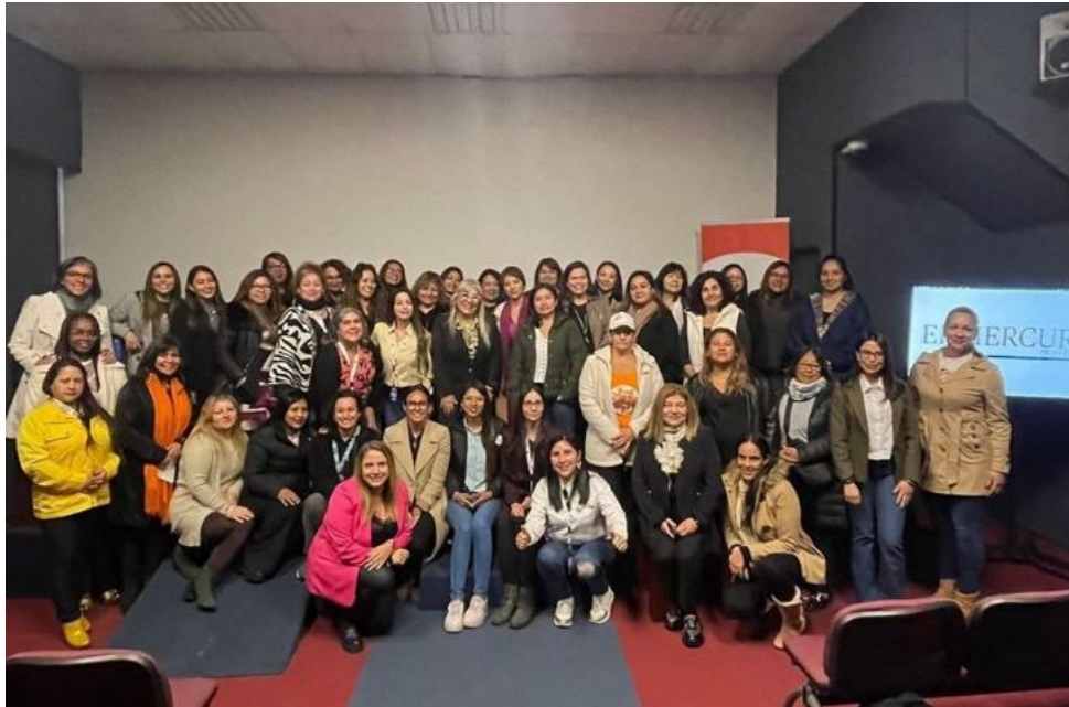
Foto General de la 3r. Cumbre de Emprendimiento Femenino: Conecta 7