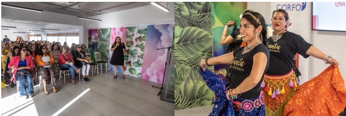
El lanzamiento del PDT Aladas concluyó con un networking y presentación artística del grupo de mujeres Ubuntu Tribal.