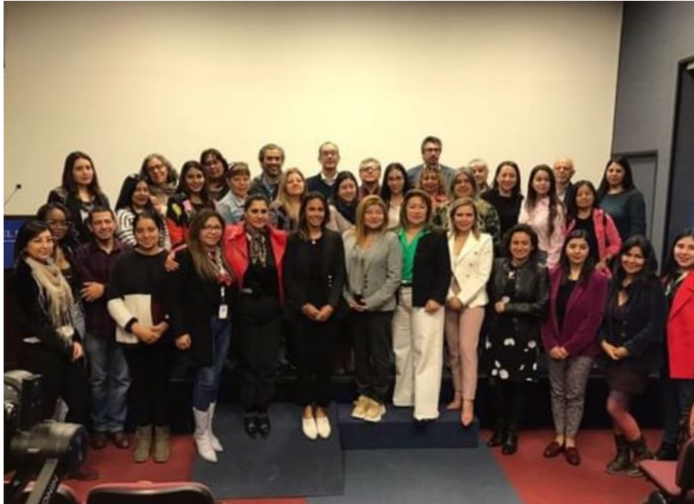
Foto general de “Seminario Impacto Verde: logística sustentable y prácticas ambientalmente sostenibles”.